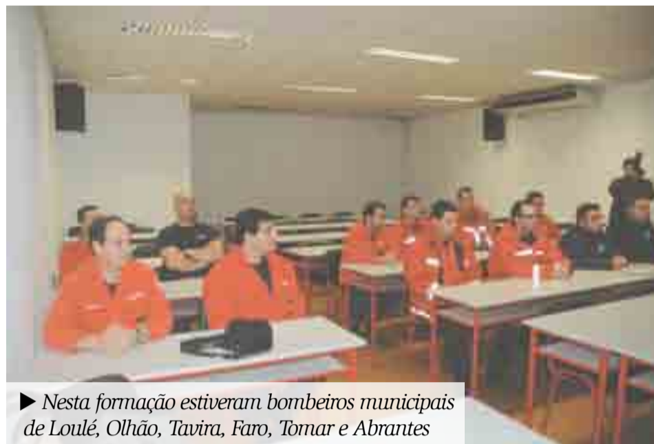
► Nesta formação estiveram bombeiros municipais de Loulé, Olhão, Tavira, Faro, Tomar e Abrantes