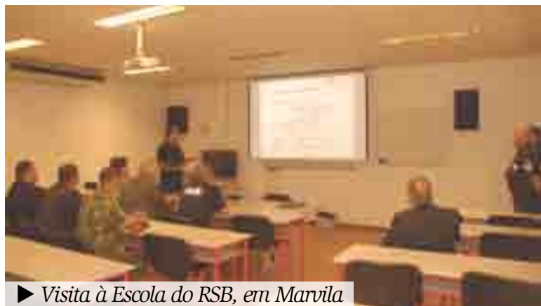
► Visita à Escola do RSB, em Marvila