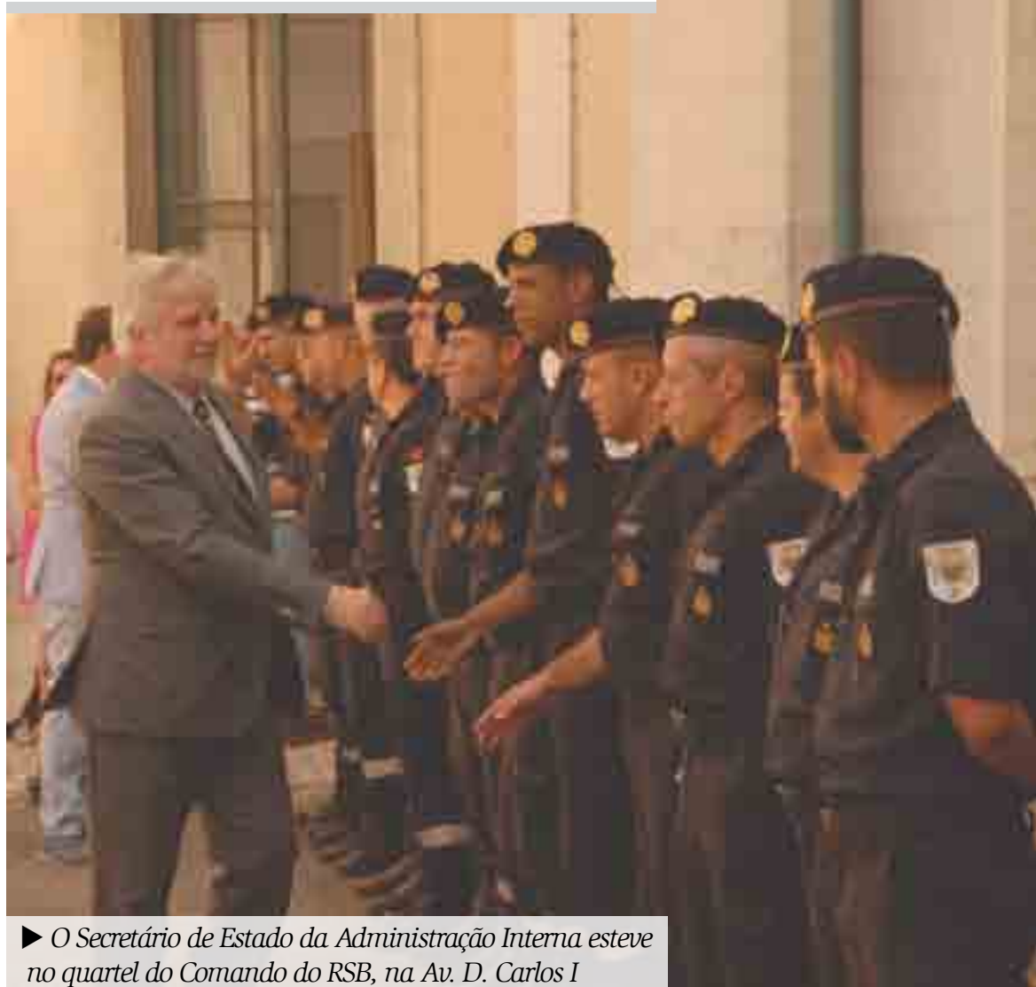
► O Secretário de Estado da Administração Interna esteve no quartel do Comando do RSB, na Av. D. Carlos I