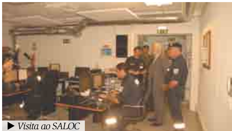
► Visita ao SALOC