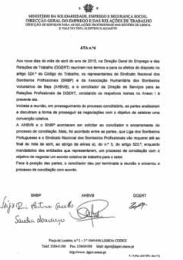
► Documentos da negociação ocorrida entre SNBP e AHBV Beja