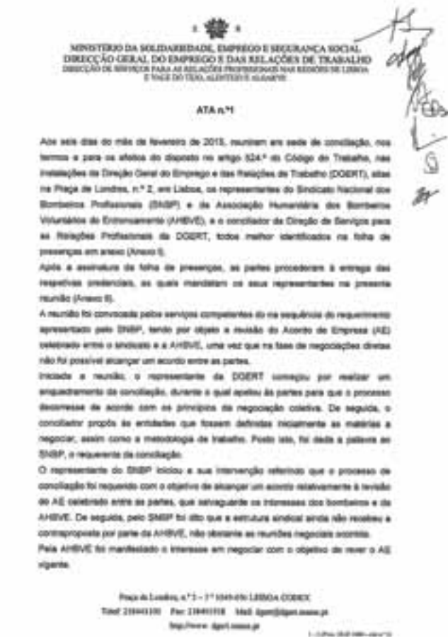
► Documentos da negociação ocorrida entre SNBP e AHBV Entrocamento