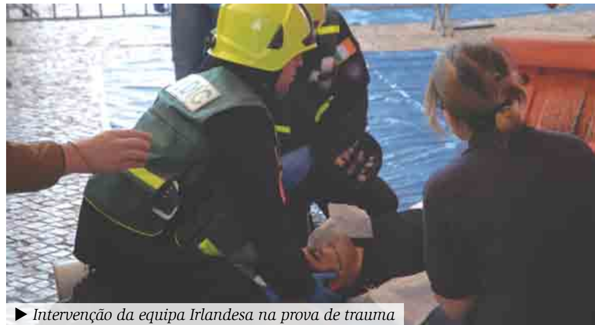
► Intervenção da equipa Irlandesa na prova de trauma