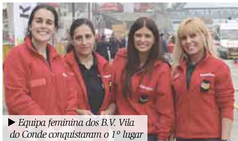
► Equipa feminina dos B.V. Vila do Conde conquistaram o 1º lugar