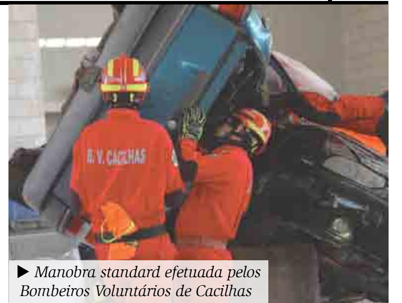
► Manobra standard efetuada pelos Bombeiros Voluntários de Cacilhas