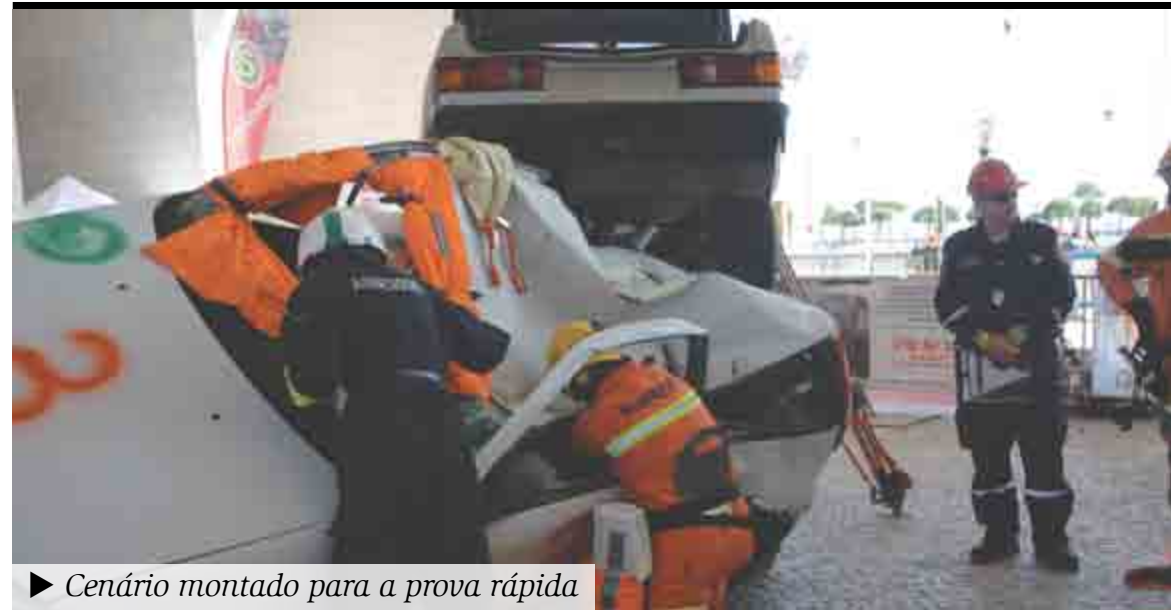
► Cenário montado para a prova rápida