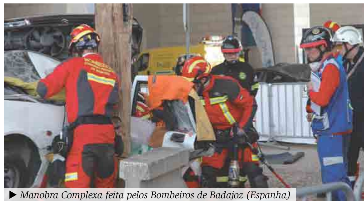
► Manobra Complexa feita pelos Bombeiros de Badajoz (Espanha)