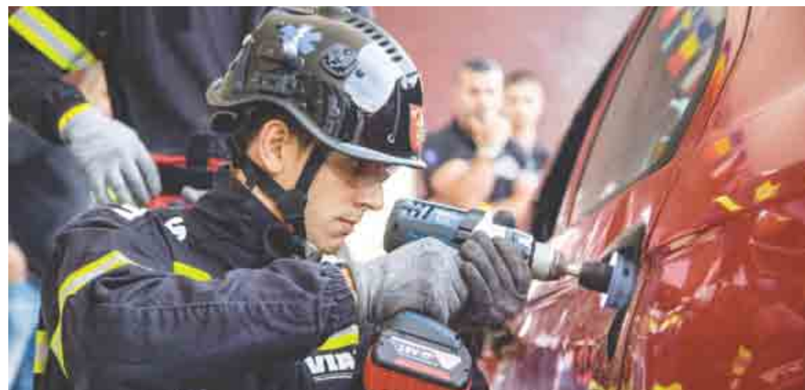
► Bombeiro da equipa do RSB testa a Aparafusadora de impacto sem fio da Bosch

A esta aparafusadora profissional da Bosch junta-se a Broca HEX-9 Multi Construction, uma união que permite aos profissionais também perfurar com esta aparafusadora, evitando a necessidade de outra ferramenta.