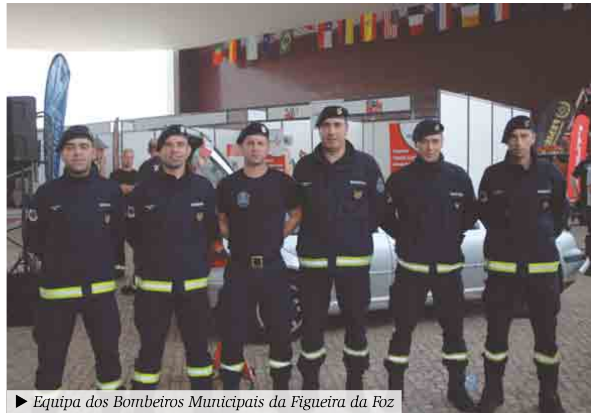
► Equipa dos Bombeiros Municipais da Figueira da Foz

Foram avaliadas as 33 equipas internacionais quanto à sua eficácia e cumprimento de regras nas provas rápida (10 minutos para retirar uma vítima do interior da viatura), standart (resgatar uma vítima em 20 minutos) e complexa (resgatar duas vítimas em 30 minutos). Quatro dessas equipas eram portuguesas: RSB, Bombeiros Municipais da Figueira da Foz, Bombeiros