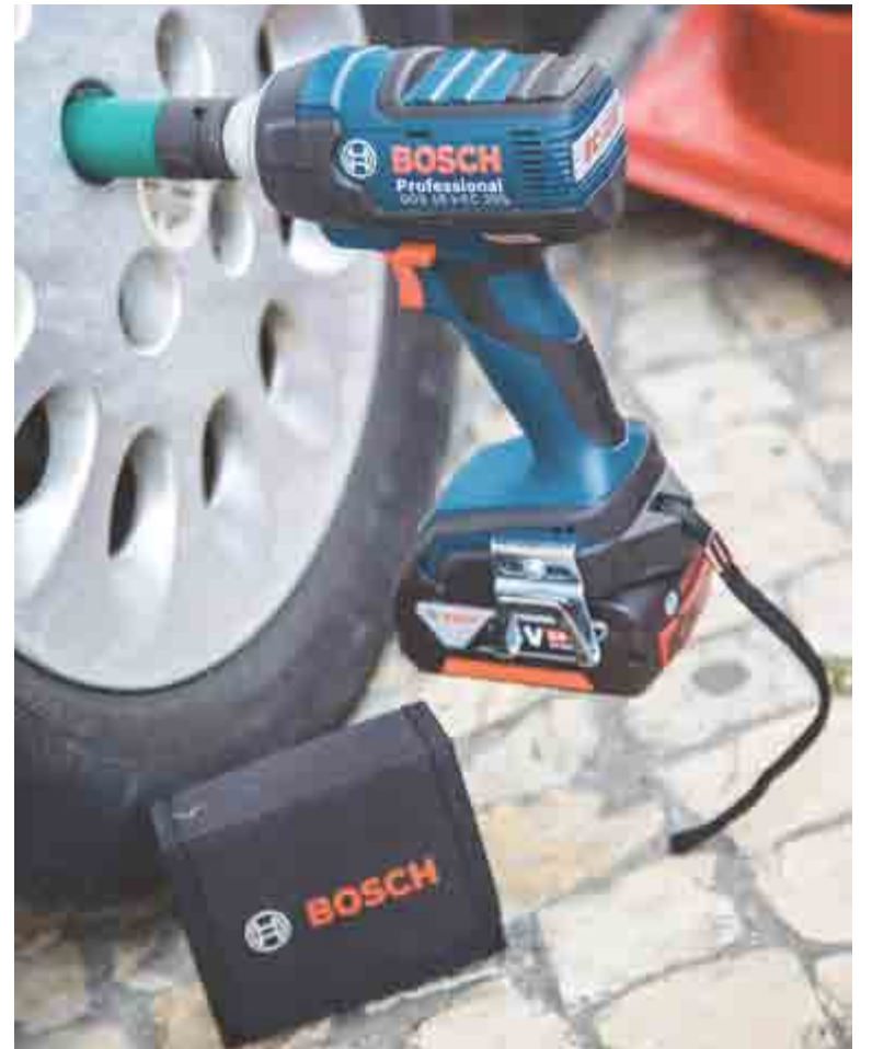
Aparafusadora GDS 18 V-EC 250 Profissional da Bosch