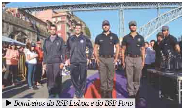
► Bombeiros do RSB Lisboa e do BSB Porto