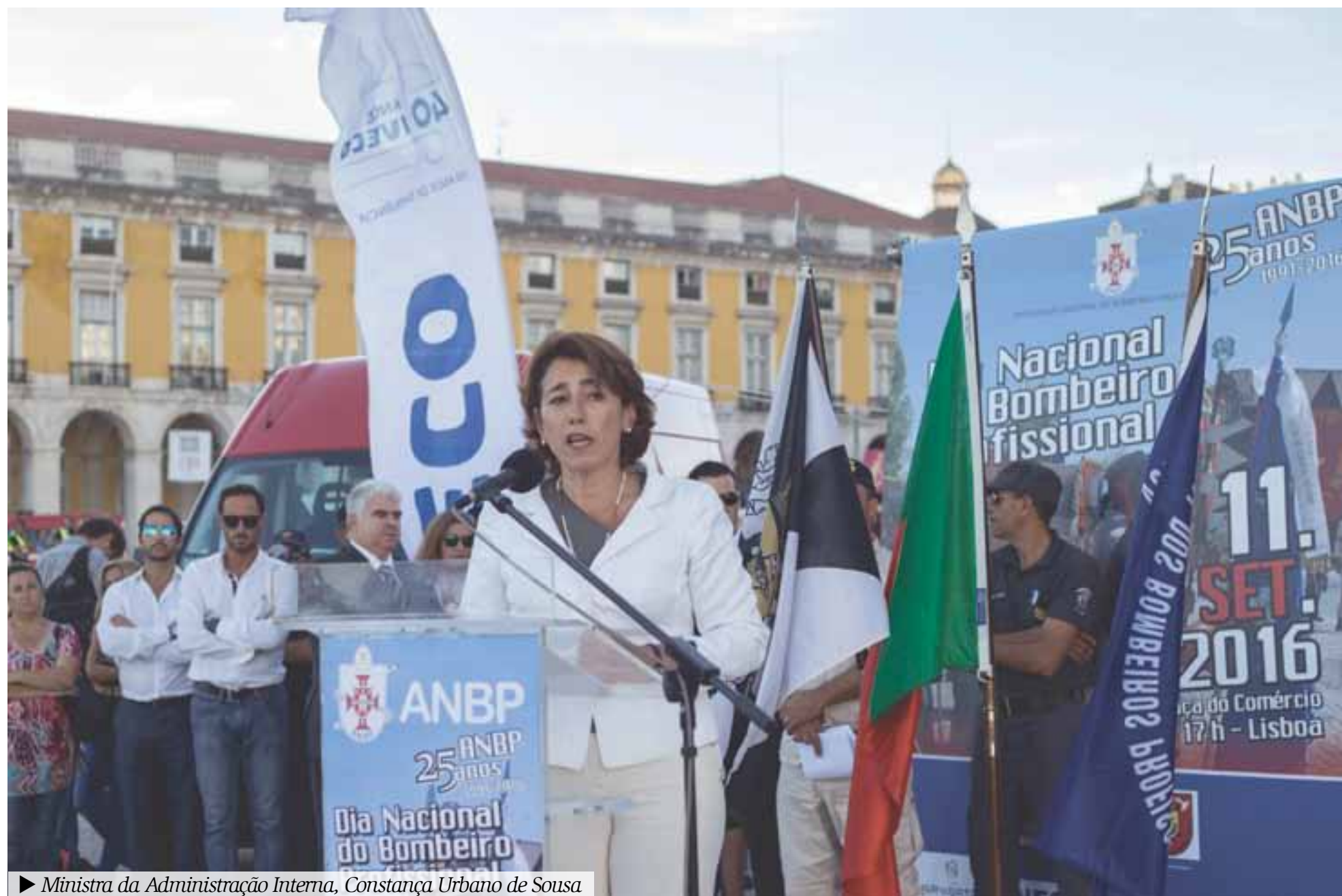
► Ministra da Administração Interna, Constança Urbano de Sousa