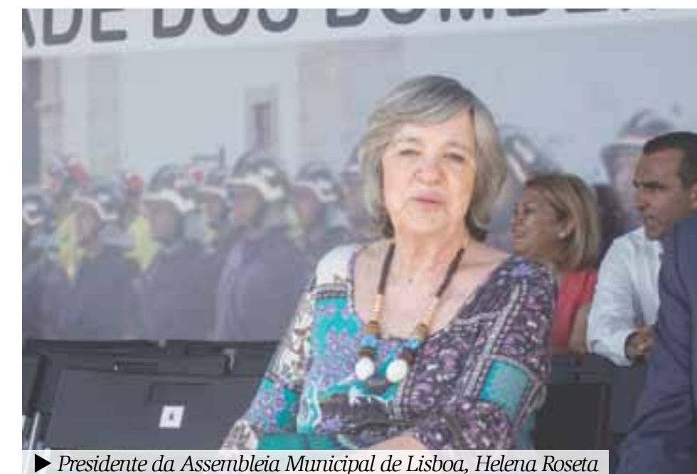
► Presidente da Assembleia Municipal de Lisboa, Helena Roseta