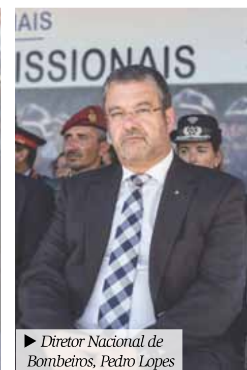
► Diretor Nacional de Bombeiros, Pedro Lopes