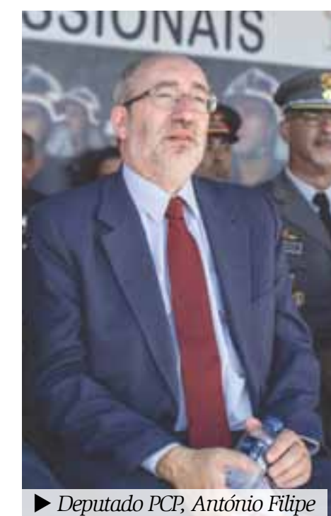
► Deputado PCR, António Filipe