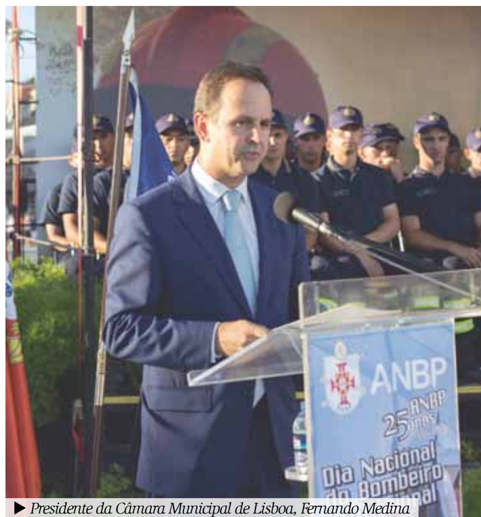
► Presidente da Câmara Municipal de Lisboa, Fernando Medina