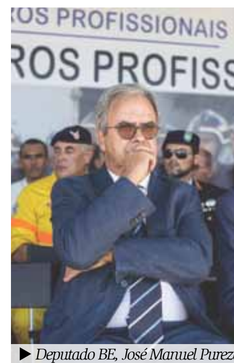
► Deputado BE, José Manuel Pureza