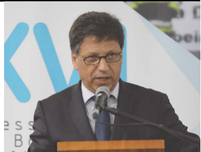
José Artur Neves, Secretário de Estado da Proteção Civil

O representante do presidente da Câmara de Lisboa na sessão de encerramento fez um discurso que incidiu na preparação das cidades contra o terrorismo. Carlos Manuel Castro destacou ainda a formação que é ministrada na Escola do Regimento de Sapadores Bombeiros de Lisboa, que recebe recrutas de todas as zonas do país.