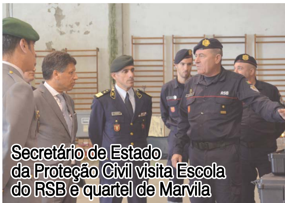
Secretário de Estado da Proteção Civil visita Escola do RSB e quartel de Marvila