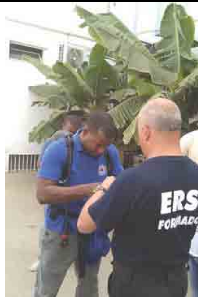
► Mais um dia de formação prática que a Escola do RSB esta a ministrar no quartel do Corpo de Bombeiros Municipais da Praia.