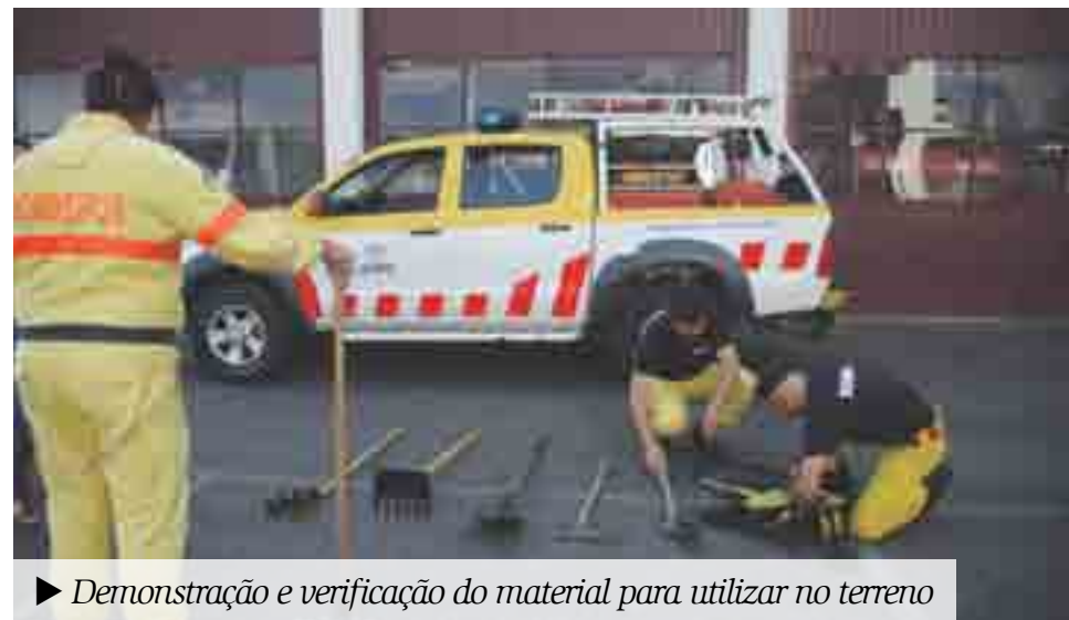
► Demonstração e verificação do material para utilizar no terreno

criada em 2007, pelo então Ministro da Administração Interna António Costa, com o objectivo de melhorar a eficácia no combate inicial aos incêndios florestais, utilizando, para isso, helicópteros guarnecidos por equipas especiais. As fardas amarelas ter-lhes-ão conferido o nome de “Canarinhos”.