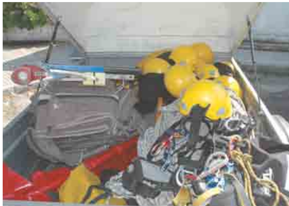
► Equipamento de Salvamento em Grande Ângulo: EPI para dez elementos, 400 metros de cabo, tripé, material para desmultiplicação e mantas