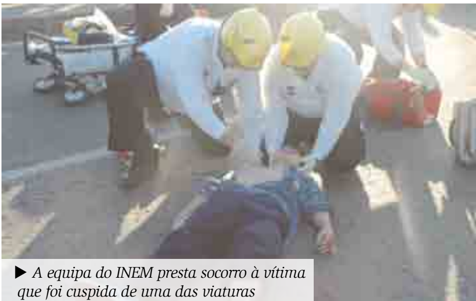
► A equipa do INEM presta socorro à vítima que foi cuspada de uma das viaturas