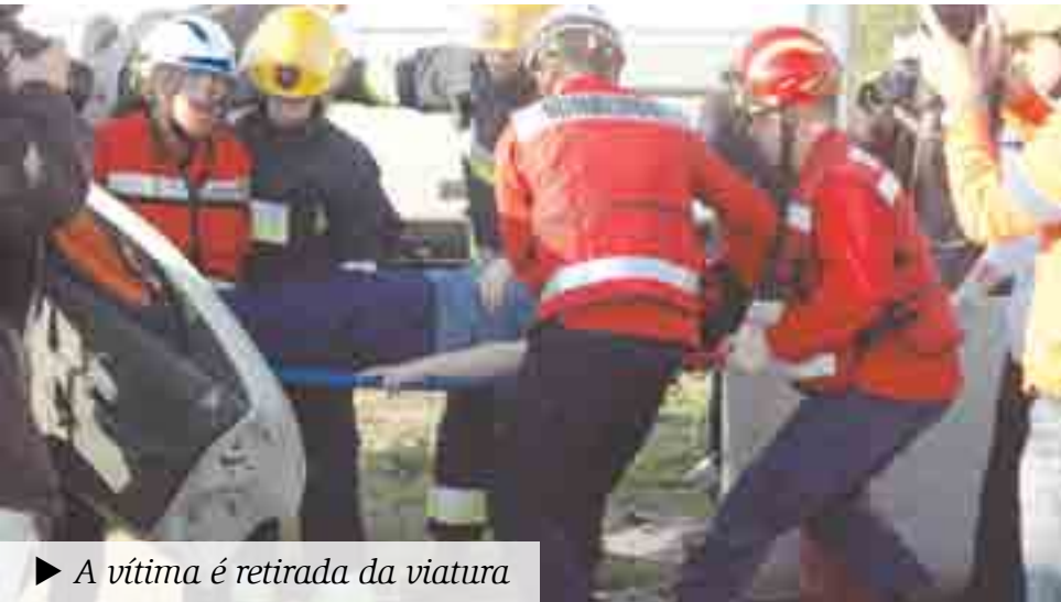
► A vítima é retirada da viatura