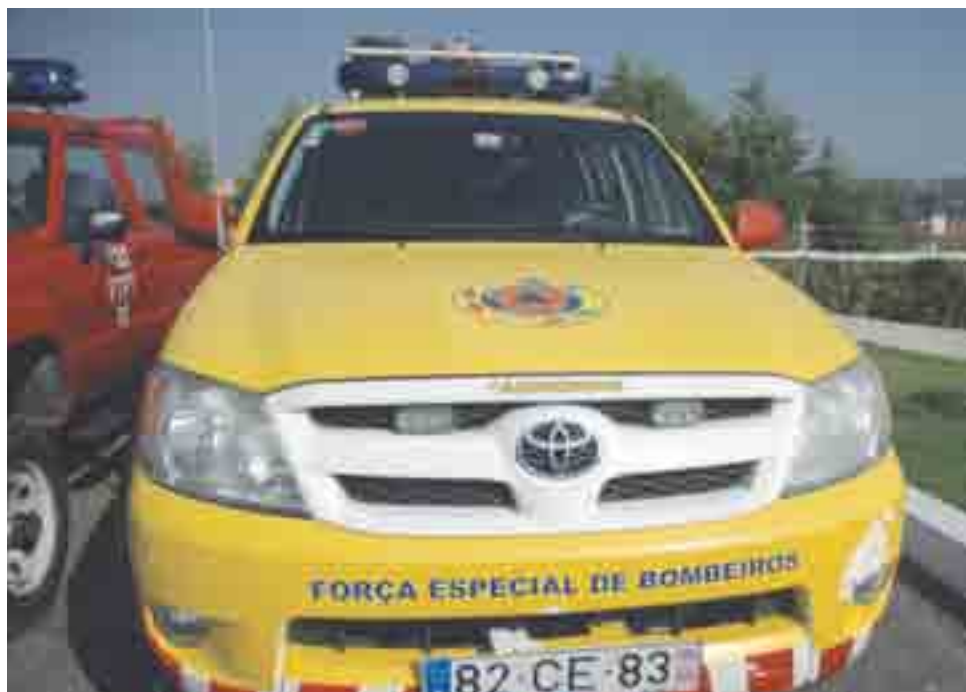
► Uma das viaturas utilizadas pela Força Especial de Bombeiros com o equipamento utilizado no teatro das operações