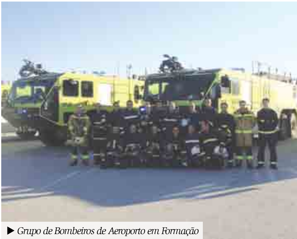
► Grupo de Bombeiros de Aeroporto em Formação