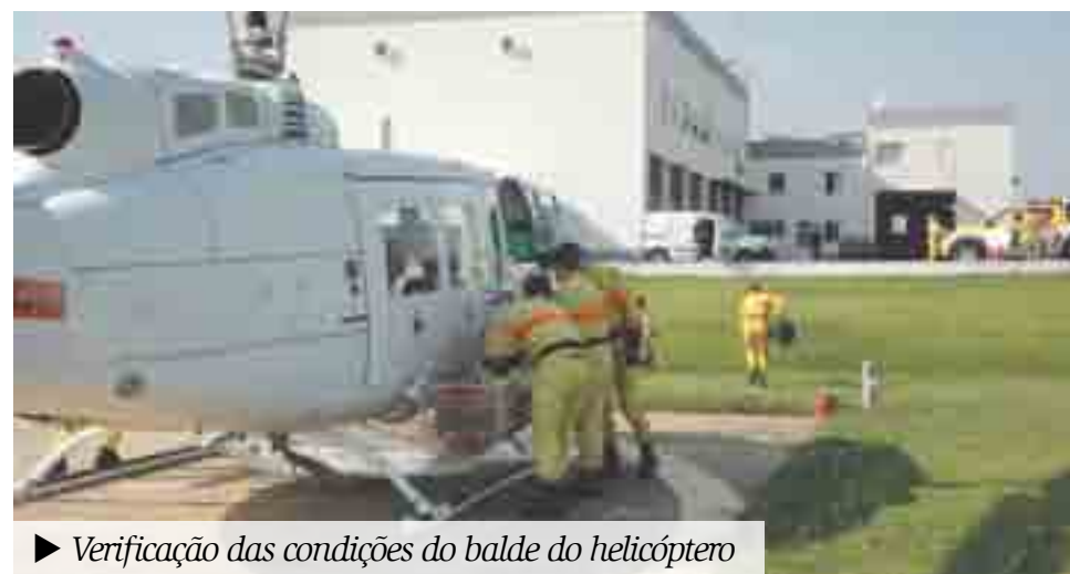
► Verificação das condições do balde do helicóptero