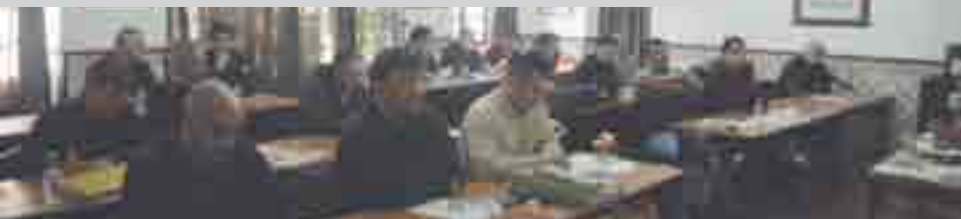
► O Conselho Geral da ANBP/SNBP é o órgão máximo das duas instituições e reúne dirigentes do Continente e da Região Autónoma da Madeira