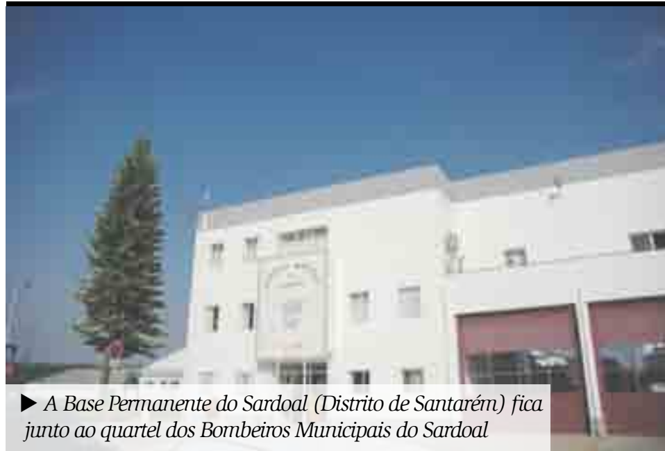
► A Base Permanente do Sardoal (Distrito de Santarém) fica junto ao quartel dos Bombeiros Municipais do Sardoal