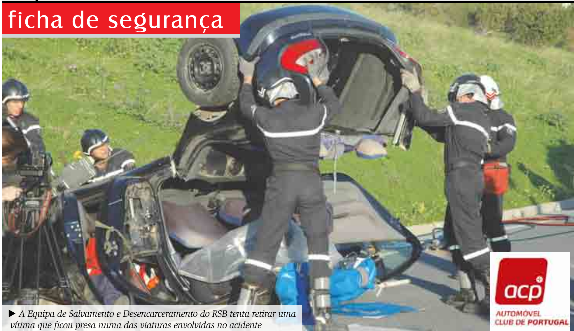
► A Equipa de Salvamento e Desencarceramento do RSB tenta retirar uma vítima que ficou presa numa das viaturas envolvidas no acidente