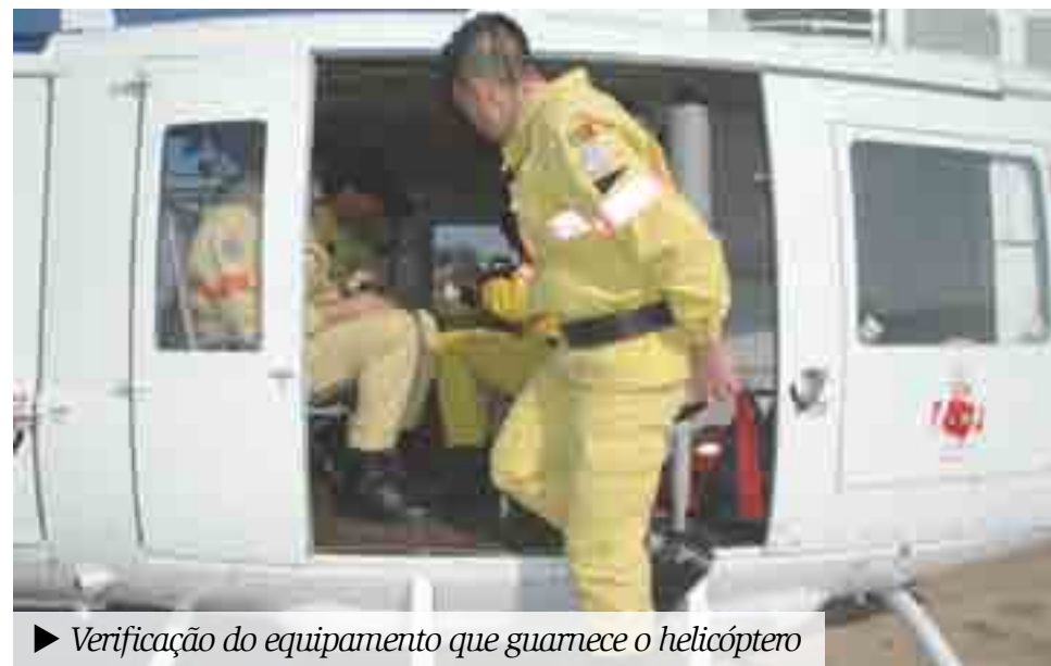
► Verificação do equipamento que garante o helicóptero