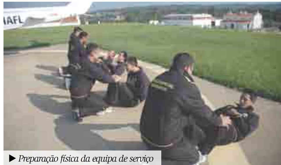
► Preparação física da equipa de serviço