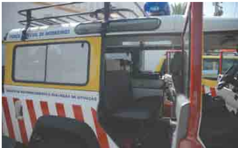
► Veículo de Reconhecimento e Avaliação da Situação: são os “olhos” do Comando, fazendo o reconhecimento das acessibilidades e pontos de água. Utiliza a georeferenciação. No seu interior há materiais como mochila de primeiros socorros, cabos e rações de combate, além de material para avaliação de situações com alta tensão)

de Beja, Évora e Setúbal que têm que fazer intervenção no grande Lago do Alqueva; em Santarém temos a Brigada Logística, que tem como função trabalhar tudo o que é a reserva nacional de protecção civil para missões nacionais e internacionais”.