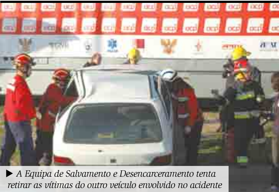
► A Equipa de Salvamento e Desencarceramento tenta retirar as vítimas do outro veículo envolvido no acidente