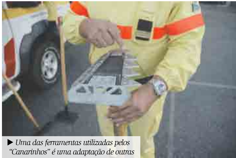
► Uma das ferramentas utilizadas pelos “Canarinhos” é uma adaptação de outras

panhias, com grupos diferenciados, consoante a actividade operacional dos sítios. Inicialmente, os elementos estavam alocados à FEB nos meses do DECIF e depois, no Inverno, iam para os corpos de bombeiros. Isto alterou-se em 2008, quando passaram a estar a tempo inteiro. Esta gestão faz-se consoante as necessidades da Protecção Civil e consoante uma hierarquia que está desenhada como sendo uma companhia que tem Equipas, Chefes de Equipa, Chefes de Brigada, Chefes de Grupo, Comandante de Companhia até ao Comando.