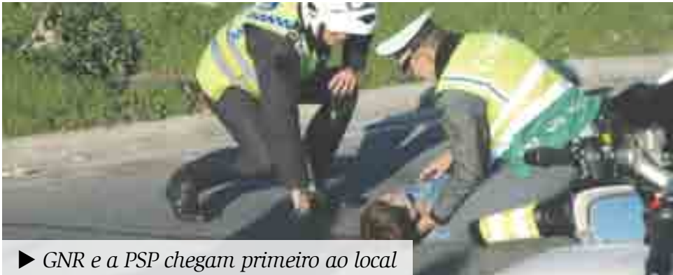
► GNR e a PSP chegam primeiro ao local

O simulacro consistia numa situação de acidente rodoviário, envol-